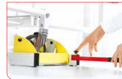
Opatentowany mechanizm podnośników pozwala na bezwysiłkowe umieszczenie ogniwa obciążnikowego pod kółkami łóżek.

Asymetryczna funkcja wartości granicznej pomaga w przeprowadzaniu dializ.