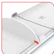
Os resultados de medição são facilmente lidos da escala ampla.

Uma dobradiça junta entre si às duas partes da prancha de medição seca 417. Ela tem uma peça de cabeça integrada e um posicionamento de pé separado, que desliza suavemente ao longo da ligeiramente elevada guia de trilho. Para uma medição precisa todo o que o usuário tem a fazer é colocar a cabeça da criança contra a peça de cabeça, esticar os pés e mover o posicionamento de pé até as plantas dos pés.