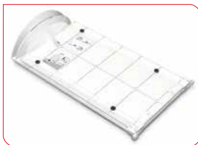
O mecanismo de dobra de alta qualidade garante uma vida de serviço longa.

O estadiômetro seca 417 é ideal para uso móvel. Durante exames marcados regularmente, o pessoal médico checa as condições nutricionais e o desenvolvimento de infantes e bebês. O processo deve ser rápido, por isso é importante poder ler os resultados facilmente. As marcações vermelhas e a impressão de alta qualidade da prancha não desvanecem, inclusive após o uso intensivo por muitos anos.