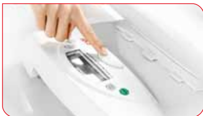
La bandeja de pesaje se puede desmontar rápidamente y fácilmente, simplemente pulsando una tecla.