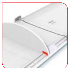
La lecture du résultat est facile à lire sur la grande échelle.

Les deux parties de la toise seca 417 sont reliées par une charnière. La toise est également dotée d'un appuie-tête intégral et d'un appuie-pieds coulissant sur des rails légèrement surélevés. Pour réaliser une mesure précise, il suffit à l'utilisateur de positionner la tête de l'enfant contre l'appuie-tête, d'étirer les jambes et de glisser l'appuie-pieds jusqu'au contact avec la plante des pieds.