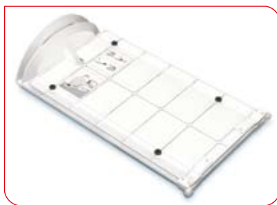
Le mécanisme pliable garantit une longue durée de vie.

Le stadiomètre seca 417 est l'outil idéal pour une utilisation mobile. Au cours des examens, le personnel médical doit contrôler l'état nutritionnel et le développement de nourrissons et de jeunes enfants. Pour le faire aussi rapidement que possible, une lecture facile des résultats est importante. Les marquages rouges et l'échelle graduée ne s'estomperont pas, même après des années d'utilisation intense.