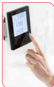
Med bara ett tryck kan du trådlöst överföra värdena till en seca 360° skrivare eller till en PC.