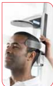
Längden visas i displayen på huvudstödet.

Med seca 360° wireless teknologi kan seca 285 trådlöst överföra värden till en seca skrivare. Med programmet seca analytics 105 tillsammans med seca 456 USB adapter kan värden trådlöst överföras till en PC som kan analysera dem och skicka dem vidare till en elektronisk patientjournal. seca 285 är EMR-integrerad och därför förberedd för att kunna skicka digital information i ett nätverk. Allt är förberett! Utnyttja möjligheterna när du vill.