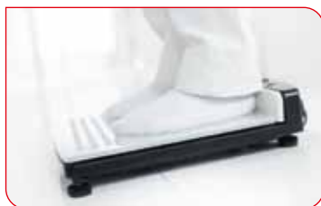
Den stabila fotplattan med hålstöd garanterar en noggrann mätning. Fotplattan har också anti-halk behandling.